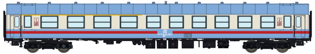
Set 48 073 14 Bm + 14 ABm, crème, lignes bleues et rouge, logo JZ, ép. V / crème, blauwe en rode lijnen, JZ logo, tp. V