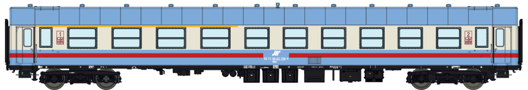
Set 48 074 14 Bm + 14 ABm, crème, lignes bleues et rouge, logo JIR, ép. V / crème, blauwe en rode lijnen, JIR logo, tp. V