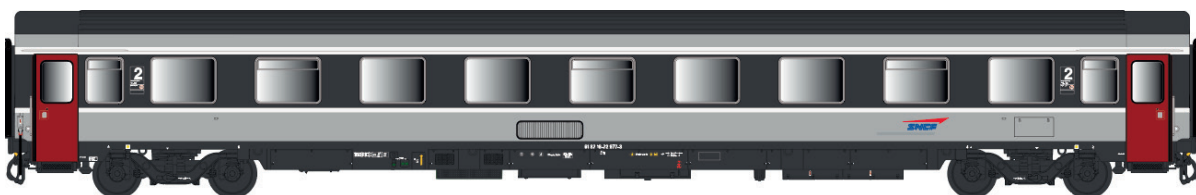
40 388 VSE B9u, Corail +, logo casquette, avec airco Ep Va