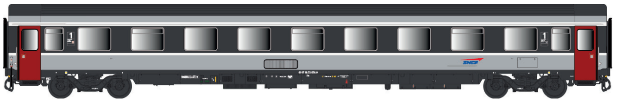
40 385 VSE A9u, Corail +, logo casquette, avec airco Ep V