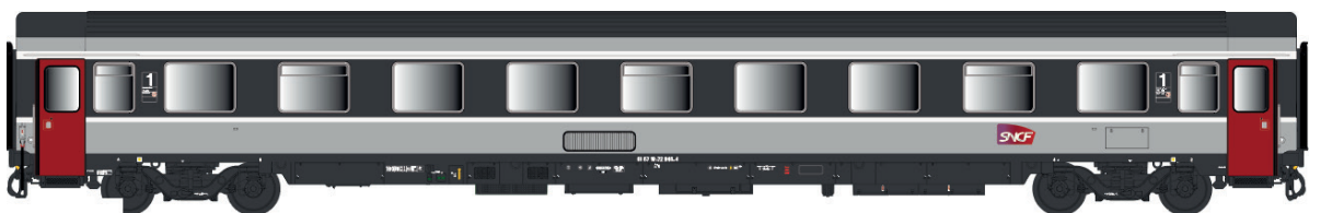
40 382 VSE B9u Ex. A9u, Corail +, logo carmillon, avec airco Ep IV