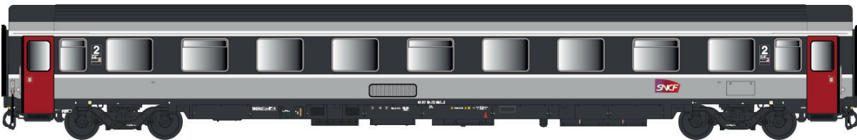
40 386 VSE A9u, Corail +, logo carmillon, avec airco Ep V-VI