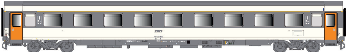
40 380 VSE A9u, Corail, logo encadré, avec airco Ep IV