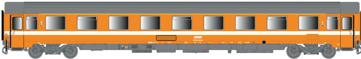
Set 40 350 VSE A9u + VSE A9u, orange, bandeau blanc, toit gris, C1, avec airco Ep IV