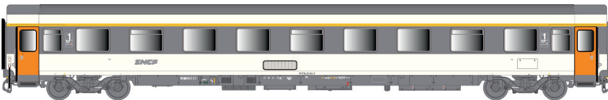
40 381 VSE A9u, Corail, logo nouilles, avec airco Ep IV