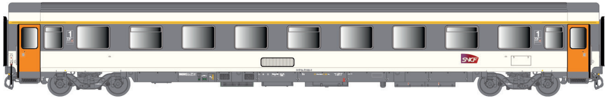
40 383 VSE A9u, Corail, logo carmillon , avec airco Ep V-VI